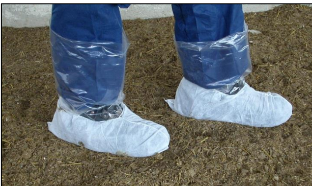
Probennahme durch Sockentupfer

Für die Legehennen schreiben die Verordnungen 2160/2003 und 1168/2006 verbindliche Untersuchungen von Kot oder Sockentupfern seit dem 01.02.2008 vor. Diese betriebseigenen Untersuchungen sind in Beständen mit mehr als 350 Legehennen mindestens alle 15 Wochen durchzuführen. Die erste Beprobung jeder einzelnen Herde eines Betriebes sollte im Alter von 24 +/- 2 Wochen erfolgen. In Betrieben mit mehr als 1000 Legehennen wird einmal pro Jahr eine der betriebseigenen Untersuchungen durch eine amtliche Beprobung ersetzt.