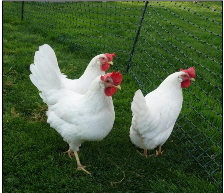
Legehennen in Freilandhaltung

Ende der 1980er Jahre traten vermehrt Salmonellen-Erkrankungen beim Menschen auf. Das Medienecho war enorm, da es sich um Salmonella Enteritidis-Infektionen handelte, die unter anderem von Konsumeiern ausgingen. Die Politik und das öffentliche Gesundheits- und Veterinärwesen haben reagiert. So hat die EU zunächst mit der sogenannten „Zoonosen-Richtlinie“ RL 92-117 EWG Vorgaben für Geflügelzuchtbestände und Brüteereien gemacht. Seitens der EU wurden 2003 mit der Verordnung (EG) 2160/2003 und weiteren darauf beruhenden Verordnungen, insbesondere VO (EG) 1168/2006 Regelungen für Legehennenbestände festgelegt. Gegenwertig sind die EU-Bestimmungen in der Geflügel-Salmonellen-Verordnung umgesetzt.