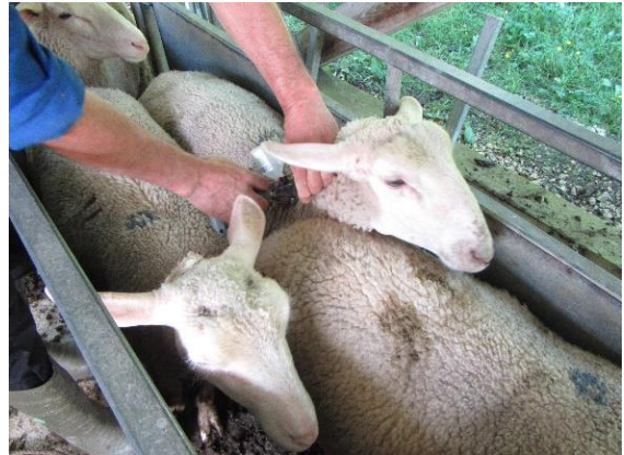
ABB. 4: IMPFUNG VON SCHAFEN GEGEN BTV

Bisherige Berichte bestätigen, dass die Impfstoffe von den geimpften Tieren gut vertragen werden. Kommt es bei geimpften Schafen und Rindern dennoch zu Erkrankungen, verlaufen diese insgesamt deutlich milder. Todesfälle wurden bei Tieren beobachtet, die z. B. durch Parasiten schon stark mitgenommen und geschwächt waren. Wichtig ist, dass sich ein Impfschutz aufbauen kann bevor sich die Tiere mit dem BT-Virus infizieren.