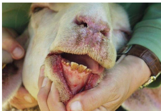
ABB. 2: SCHLEIMHAUTSCHÄDEN IM MAULBEREICH BEI EINEM SCHAF

Zum Nachweis der BTV-Infektion sind ausschließlich EDTA-Blutproben geeignet. Im Labor werden diese mittels Polymerase-Kettenreaktion (PCR) untersucht. Je nach Probenaufkommen liegt das Ergebnis bereits nach ca. 1-2 Tagen vor. Der Untersuchungsantrag für BTV-Einsendungen ist aus HIT zu erstellen.