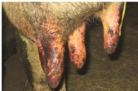
ABB. 3: HAUTSCHÄDEN AM EUTER BEI EINEM RIND