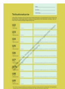
Izvor: Zajednički savezni odbor