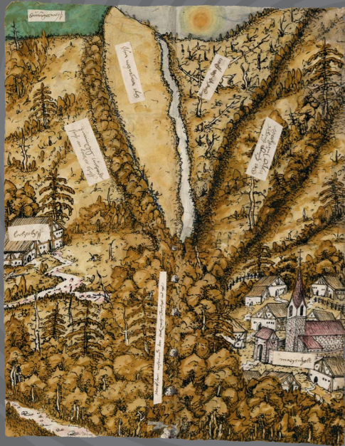
Augenscheinkarte mit Locherhof und Mariazell, 1530, Landesarchiv Baden-Württemberg, Hauptstaatsarchiv Stuttgart, C 3 Bü 2784 Qu 11