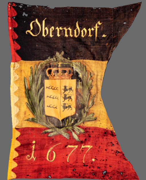
Bürgermilizfahne der Stadt Oberndorf mit württembergischem Wappen, 1677 / 1817, Museum im Schwedenbau, Oberndorf am Neckar