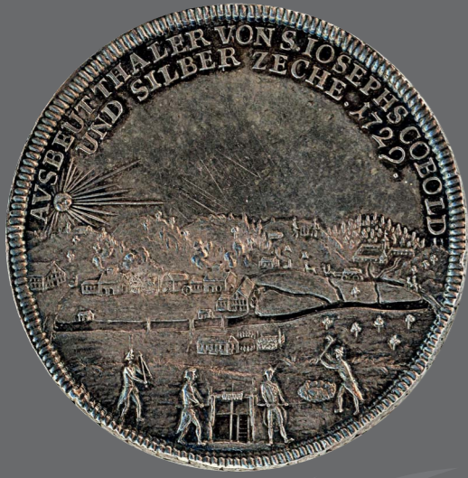
Ausbeutetaler, Kobalt- und Silberzeche St. Joseph bei Wittichen, 1729, Fürstlich Fürstenbergische Sammlungen, Donaueschingen