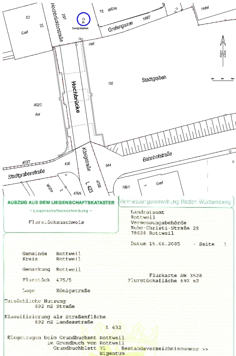
Automatisierte Liegenschaftskarte (ALK) und Automatisiertes Liegenschaftsbuch (ALB)

Die Unterlagen des Liegenschaftskatasters sind auch für die Nachvollziehbarkeit der Flurstücksentwicklung von entscheidender Bedeutung.